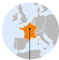
GARE DU NORD PARIS, FRANCE